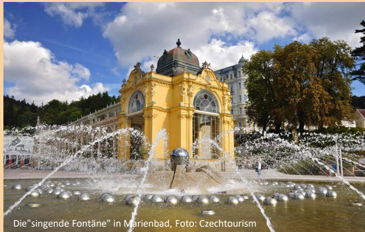
Die "singende Fontäne" in Marienbad

Neben der beeindruckenden Altstadt, die zum Weltkulturerbe der UNESCO gehört, können Sie die berühmte Karlsbrücke und den Hradschin, die größte Burganlage Europas bestaunen. Ab Ende November erleben Sie den Zauber der böhmischen Weihnacht. Zahlreiche Weihnachtsmärkte verteilen sich über die ganze Stadt und versprühen einen ganz besonderen Charme. Hier füllen sich Einkaufstaschen rasch mit traditionellem Weihnachtsgebäck, böhmischen Glaserzeugnissen, Holzspielzeugen und regionalen Kunsthandwerken. Mit einer Auswahl an landestypischen Leckereien, wie dem mit Puderzucker überschütteten Walnuss-Gebäck „Trdelník“, werden Ihre Geschmacks-nerven in weihnachtliche Stimmung versetzt.